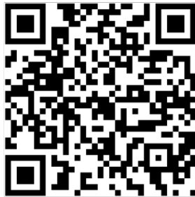
台東咖啡品牌官網