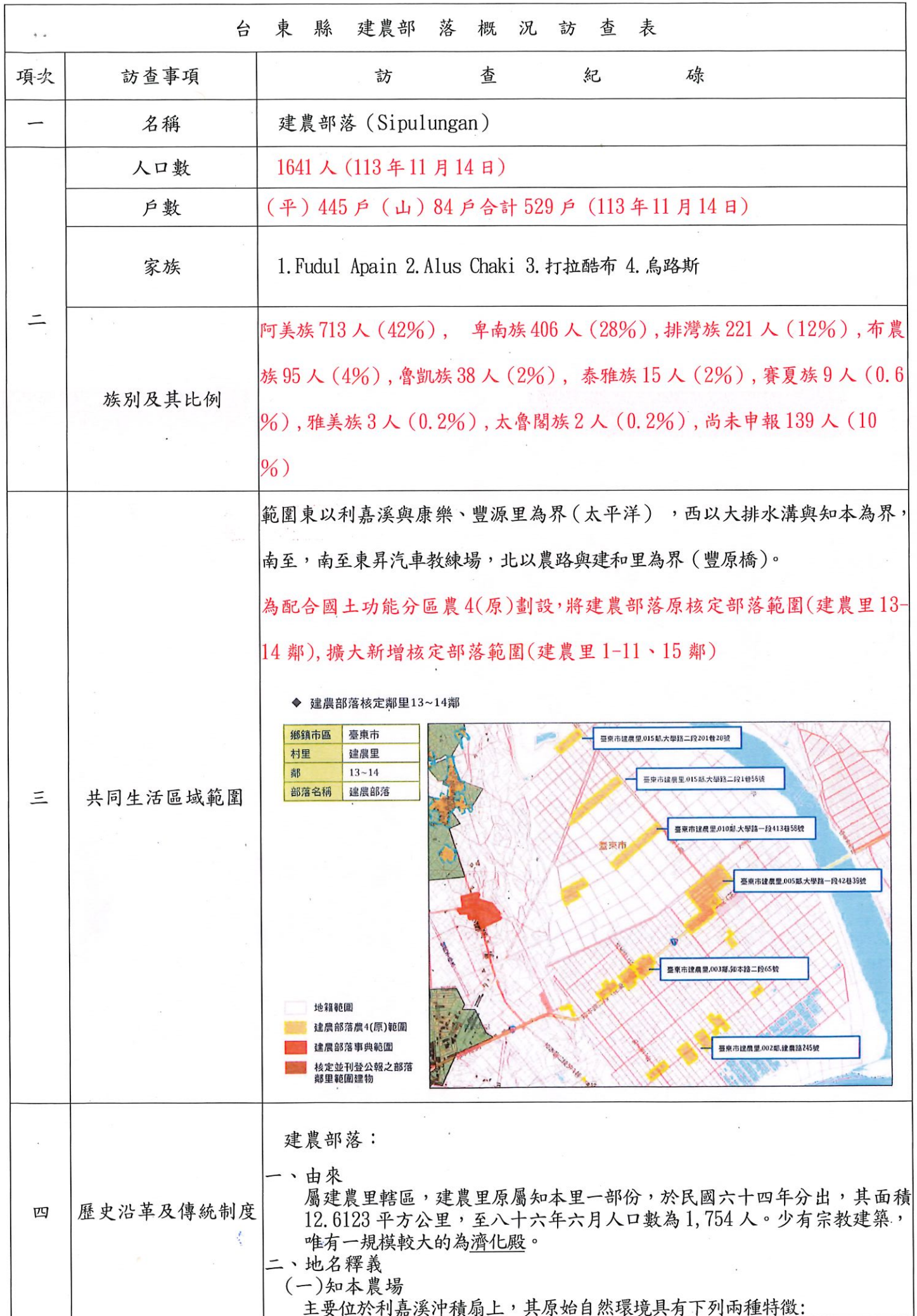
台東縣建農部落概況訪查表