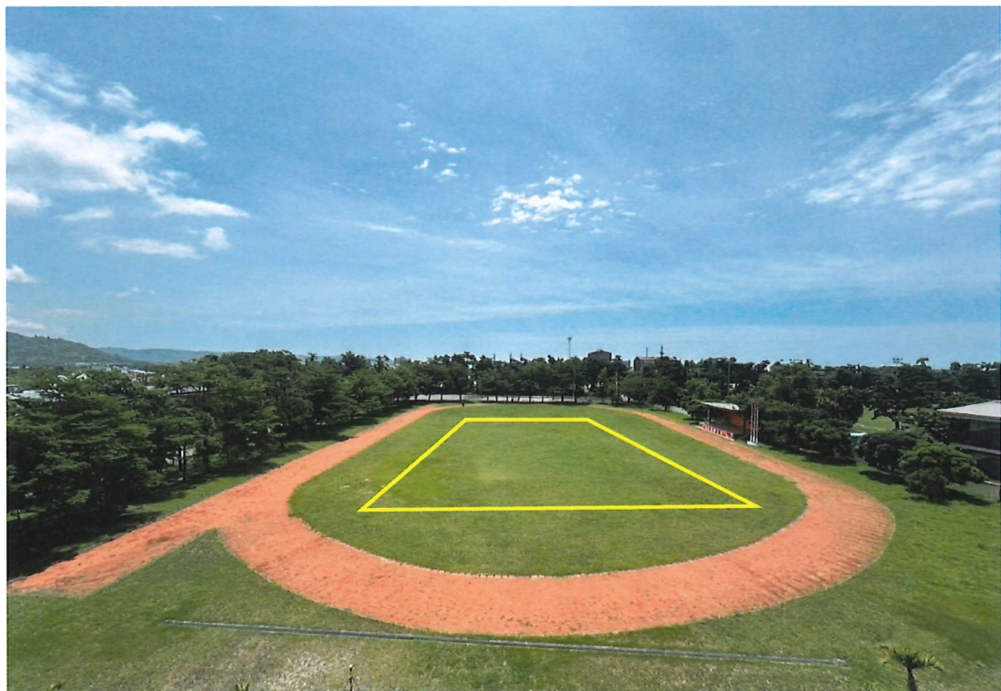
圖 2、預計鋪設範圍圖