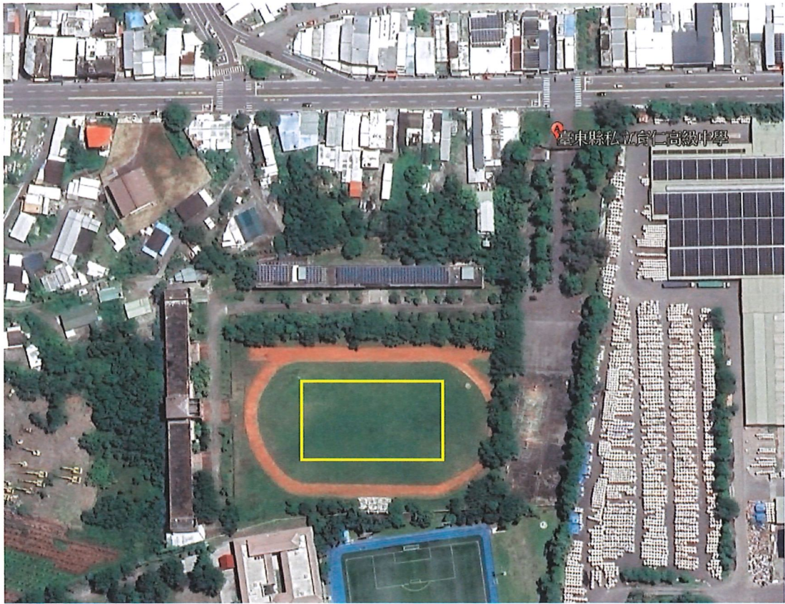
圖 1、育仁高中空拍圖