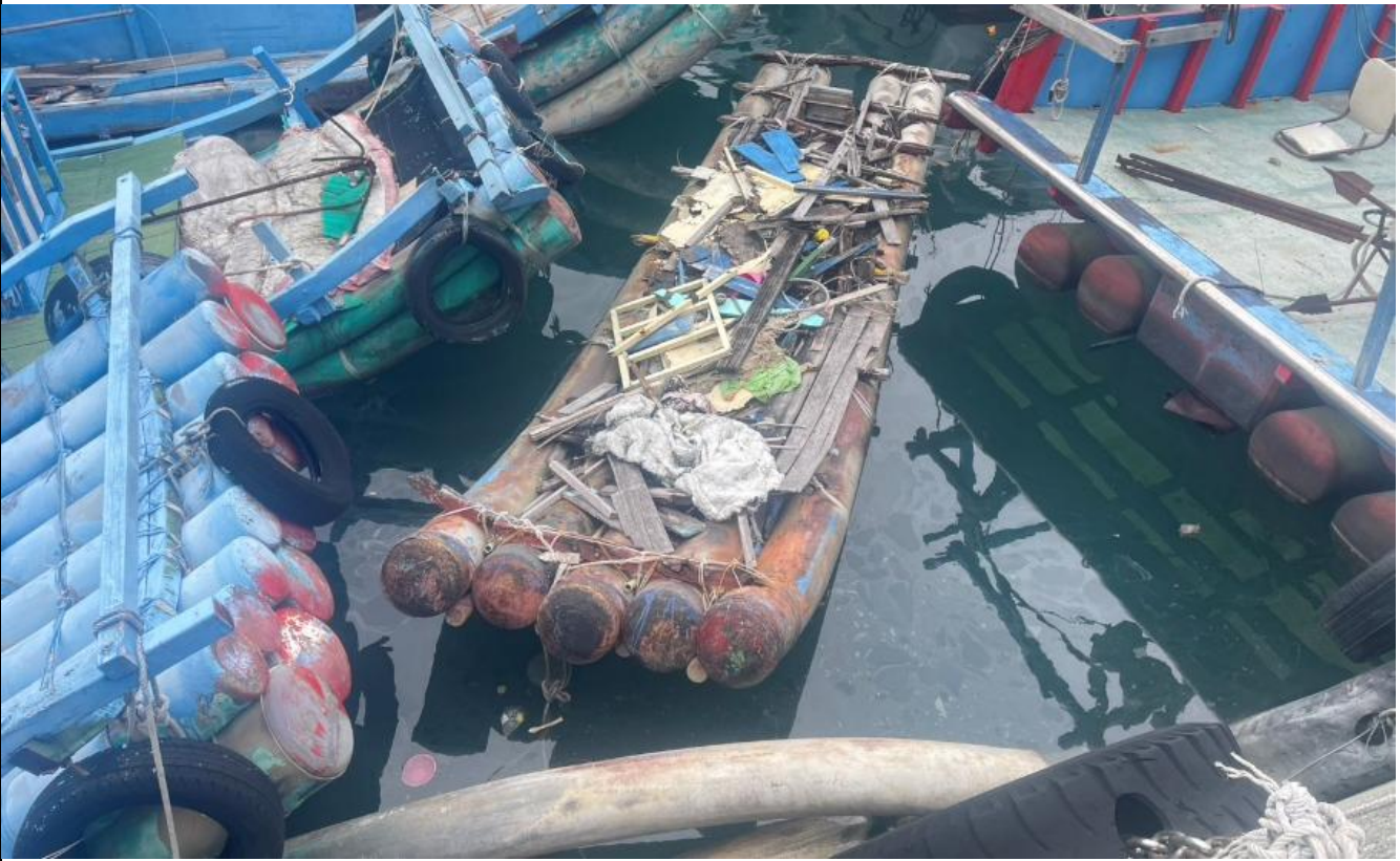
新港漁港無籍船筏照片